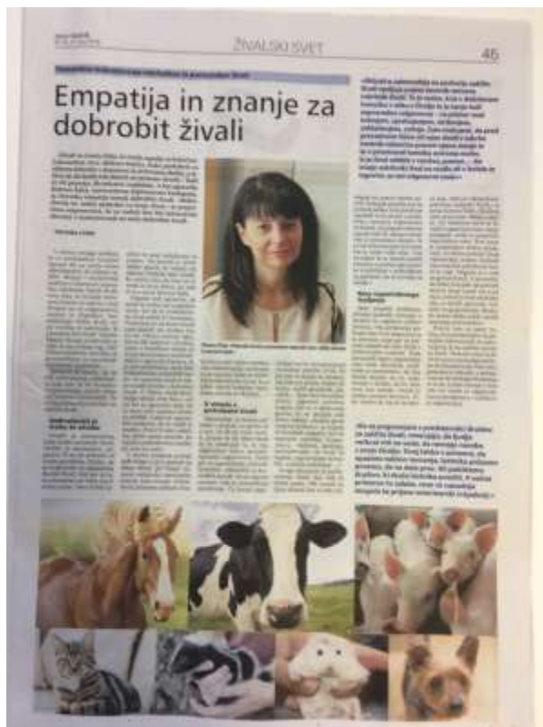
Novi Tednik, junij 2019